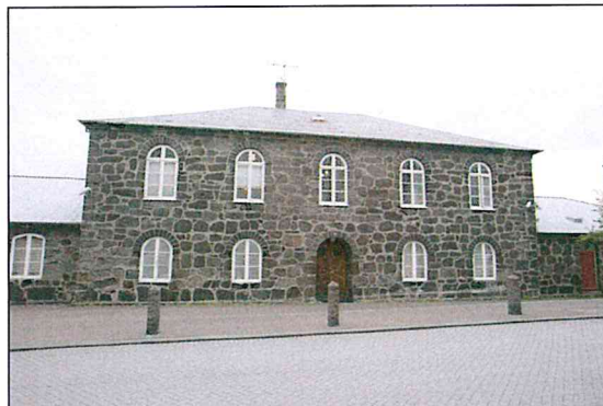
Mynd 1. Hegningarhúsið við Skólavörðustíg.