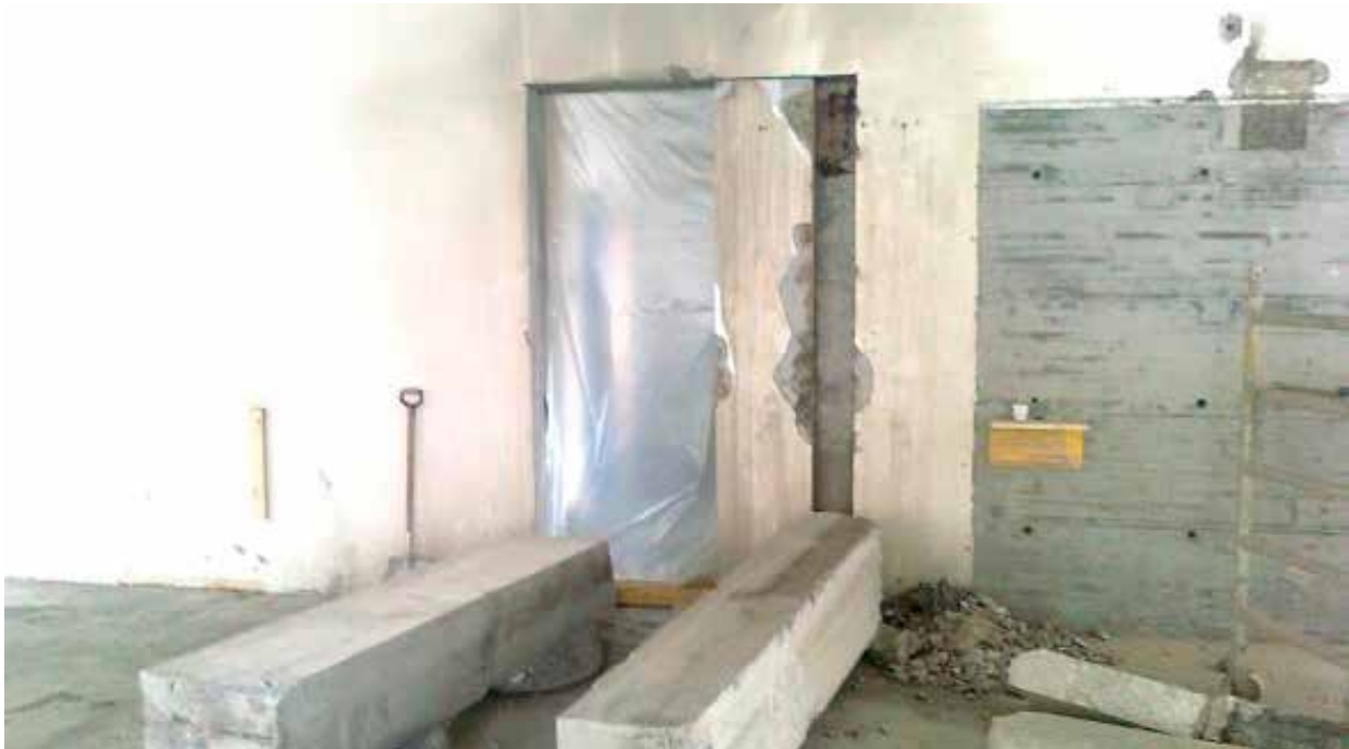
Mynd 2. Innanhúsfraukvæmdir í fullum gangi.