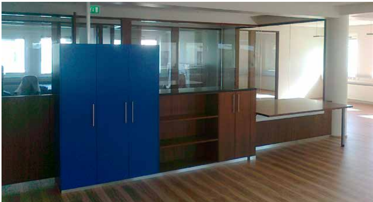
Mynd 3. Eftir endurbætur.