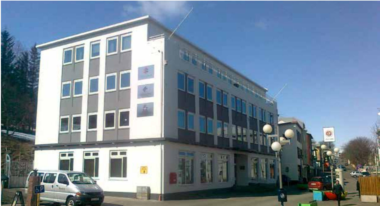
Mynd 1. Hafnarstræti 107, Akureyri.