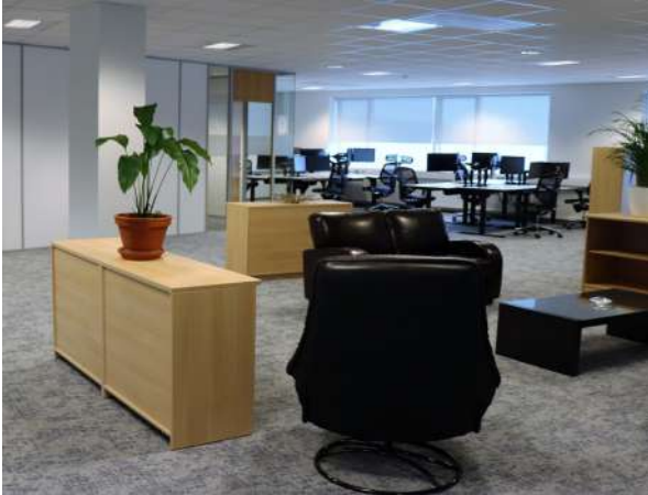
Mynd 3. Eitt af fjölnotarýmum Sjúkrtrygginga. Vinnustöðvar fjær.