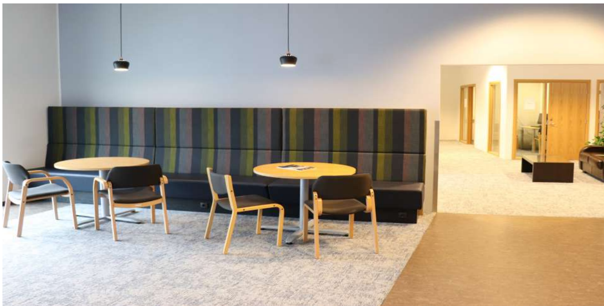
Mynd 2. Eitt af fjölnotarýmum Sjúkrtrygginga. Fundar- og næðisrími fjær.