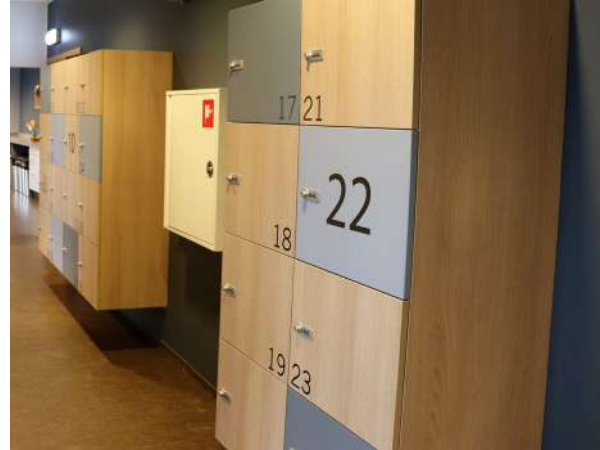
Mynd 4. Hver starfsmaður á sinn munaskáp.

Framkvæmdir við húsnæðið hófust í júlí 2017 og þeim lauk í febrúar 2018.