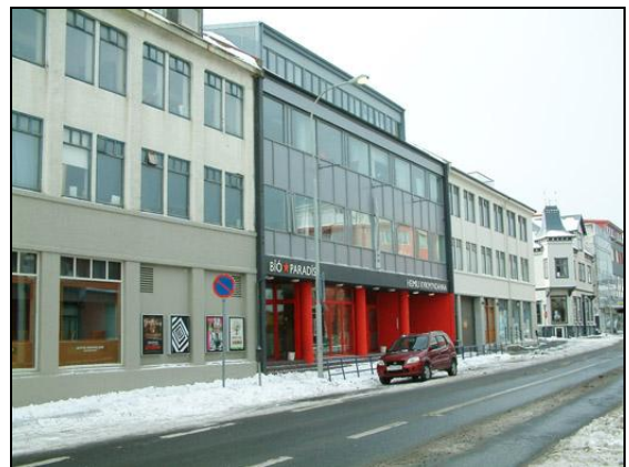
Kvikmyndamiðstöð Íslands, Hverfisgötu 54.