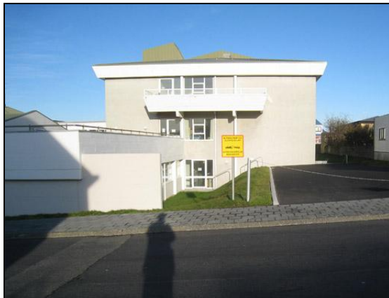
Aðkoma slökkvi- og björgunartækja.

Tilboð voru opnuð 7. apríl 2009. Niðurstöður útboðsins eftir yfirferð tilboða voru eftirfarandi.