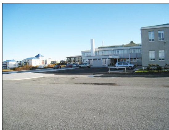
Yfirlit að bílastæði.

Gamalt bílastæði vöruaðkomu meðfram A-álm, sem er 526m 2 að stærð, var yfirlagt, eiturefnatankur á lóðinni fjarlægður, hlaðinn veggur milli D-álm og útitröppu, steypur veggur við innkeyrslu að Sóleyjargötu fjarlægður og settir staurar og skilti við Skólaveg.