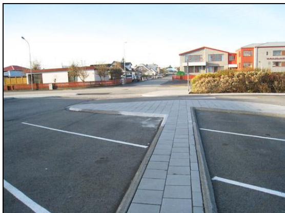
Gangstétt milli bílastæða.

Framkvæmdir hófust 27. maí 2009 með greftri og jöfnun lóðar við Skólaveg. Niðurföllum var komið fyrir, útitröppur hlaðnar, gengið frá mold og lóðin tyrfd austan við húsið. Jafnframt voru plön gerð klár fyrir malbik, þau malbikuð og kantsteinar steyptir í byrjun júlímánaðar. Í framhaldinu var síðan unnið í stéttum. Þann 18. ágúst var bílastæðið tekið í notkun.