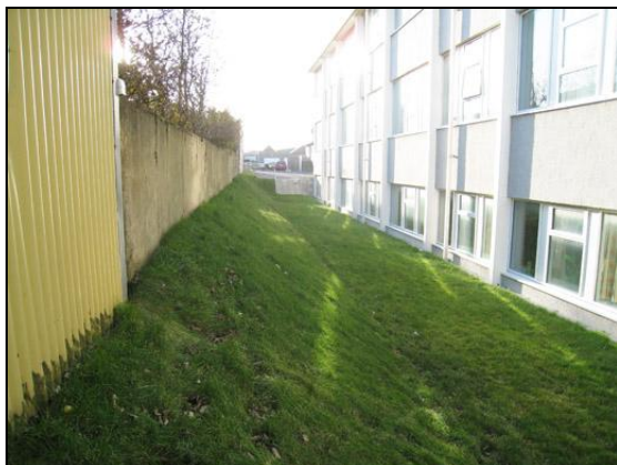
Ofan við D-álm.