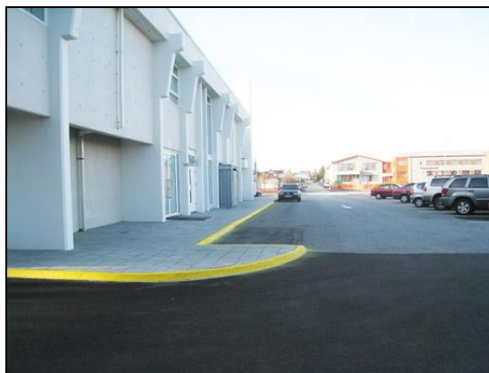
Vestan við B-álm.