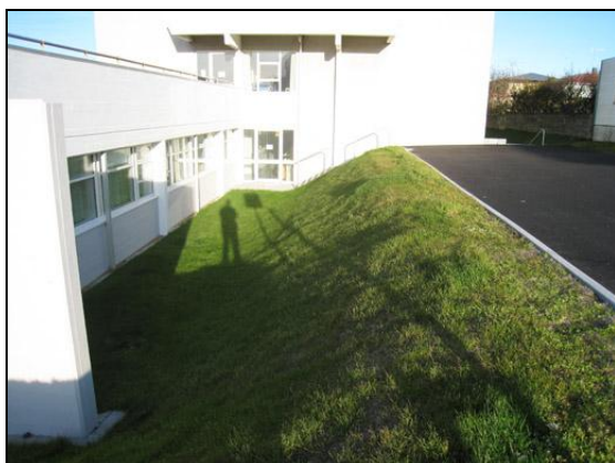
Lóðarfrágangur norðan við C-álm.