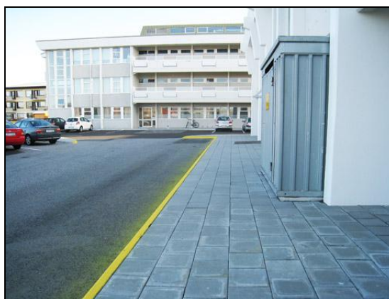
Séð yfir að D-álm.

Gamalt bílastæði vöruaðkomu meðfram A-álm, sem er 526m 2 að stærð, var yfirlagt, eiturefnatankur á lóðinni fjarlægður, hlaðinn veggur milli D-álm og útitröppu, steypur veggur við innkeyrslu að Sóleyjargötu fjarlægður og settir staurar og skilti við Skólaveg.