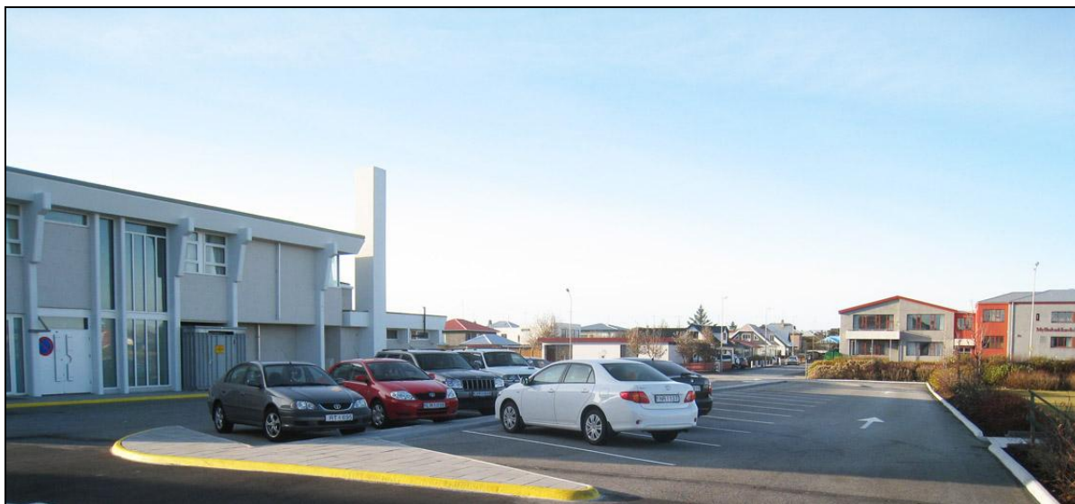
Heilbrigðisstofnun Suðurnesja, lóð frágengin.