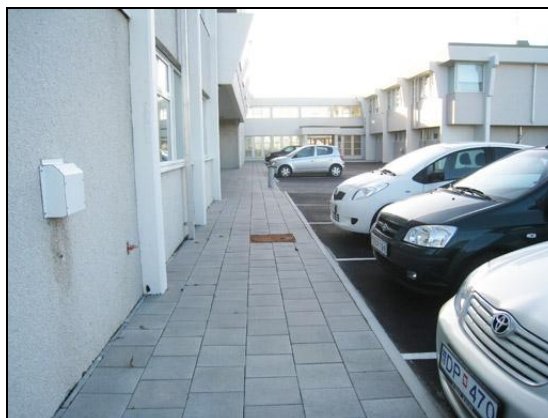
Svæði sunnan við D-álm.