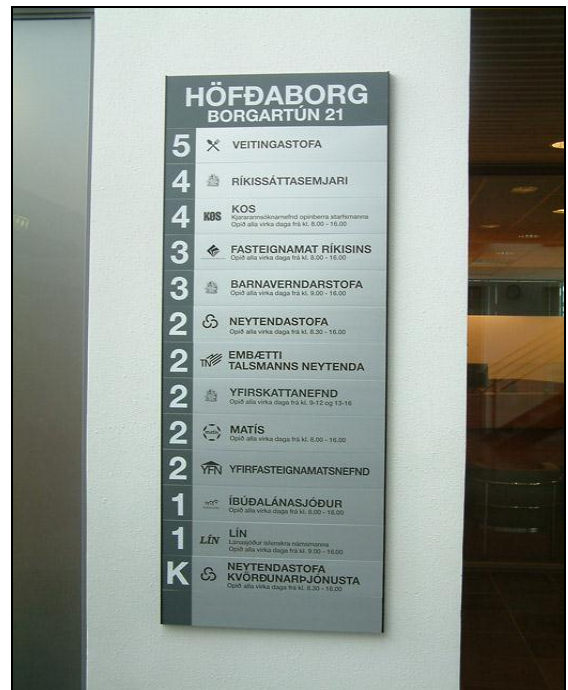
Ýmsar stofnanir eru í Höfðaborg, Borgartúni 21.

Tímaáætlanir stóðust og flutt var inn í húsnæðið í desember 2007.