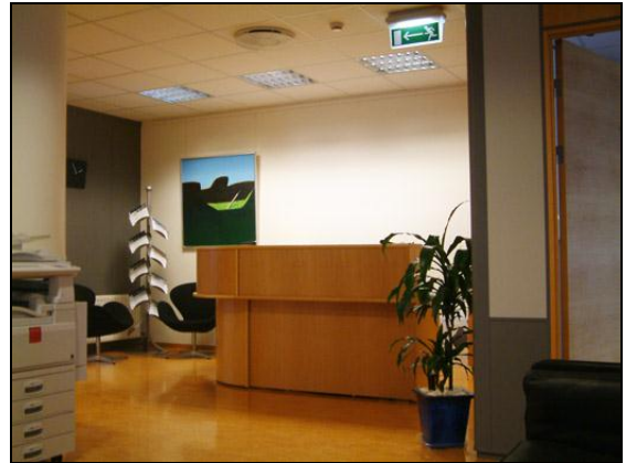
Móttaka Matís á 2. hæð í Borgartúni 21.