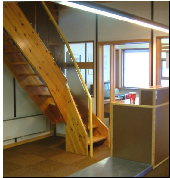
Innrétting í byggingunni fyrir breytingu.