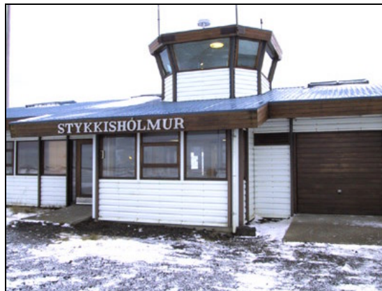
Flugstöðin fyrir breytingu.