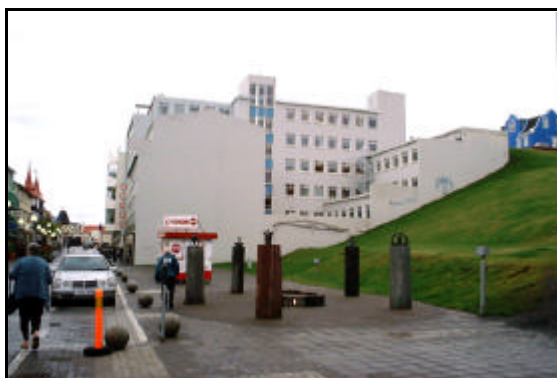
Norðurhlið Hafnarstrætis 99-101

Hér verður gerð grein fyrir framkvæmdum við breytingar á 5. hæð Hafnarstrætis 99-101 (AMARÓ-hússins) á Akureyri og hún innréttuð fyrir heilsugæslustöð. Endurnýjun 4. og 6. hæðar var gerð á árunum 1994-1999. Endurinnrétting hluta 5. hæðar hússins fór fram árið 2001. Þar er um gagngera endurnýjun að ræða á stærstum hluta hæðarinnar, á alls 464,3 m 2 að meðtalinni sameign. Til stendur að hefja framkvæmdir við 3. hæðina á næsta ári þ.e. 2004.