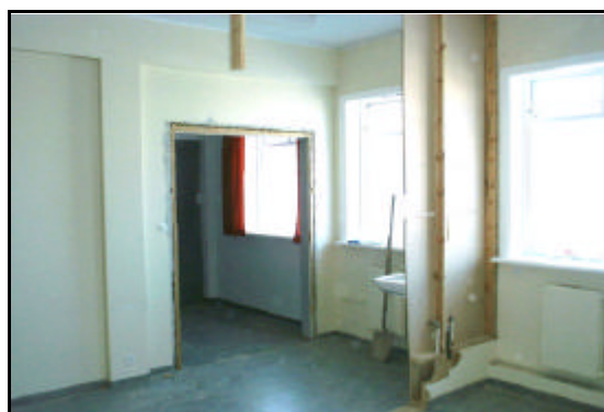
Milliveggir voru fjarlægðir að hluta