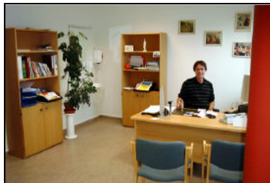
Læknir inni á stofu sinni

heilsugæslustöðvarinnar eru þó enn heldur slæm, þar sem lyftan í aðalinngangi er úr sér gengin. Einnig eru bílastæði fyrir starfsfólk og sjúklinga ekki næg og þarfnast því frekari útfærslu.