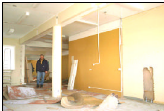
Unnið við hreinsun úr húsinu

Verktaki hóf framkvæmdir samkvæmt verkáætlun í byrjun apríl 2001 og þá við rif og hreinsun. Verktakinn var á áætlun allan verktímann og lauk framkvæmdum um mánaðarmótin ágúst - september 2001.