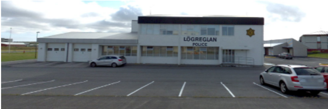
Mynd 1. Hringbraut 130 Keflavík.